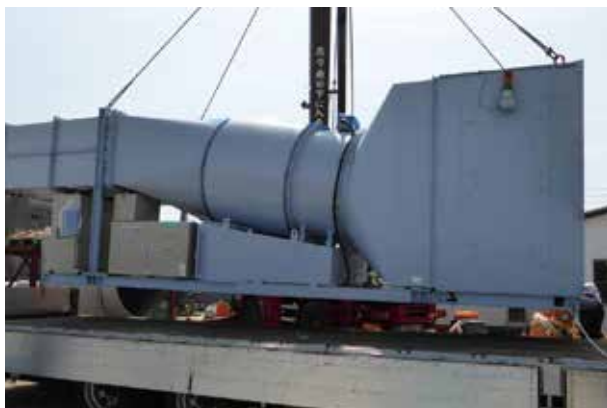
M-ECXV3000 エコクリーン XV (処理風量：3,000m 3 /min)

M-ECXV2400 エコクリーンXV/M-ECXV2700 エコクリーンXV/ M-ECXV3000 エコクリーンXV