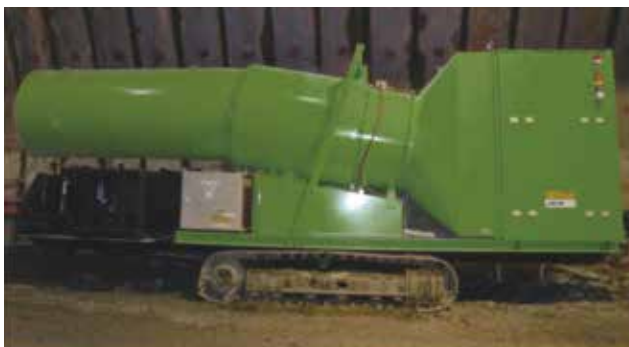
エコクリーン X (処理風量 : 2,400m 3 / min)