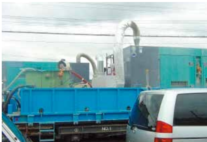
発電機（220kVA）接続例（鉄道トンネル補修のため車両に搭載）