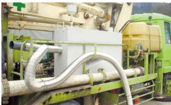
コンクリートポンプ車 搭載例