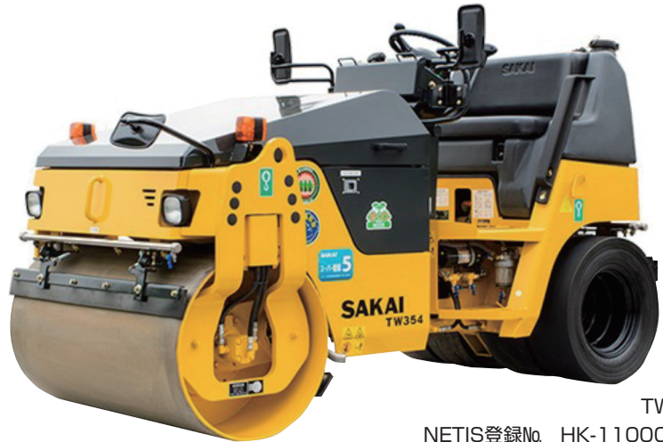
TW354 NETIS登録No. HK-110006-VE