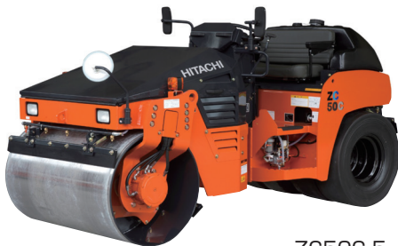
ZC50C-5 NETIS登録No. TH-100028-VE