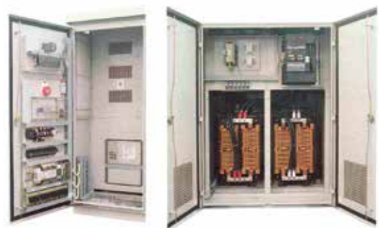
サイリスタ制御盤内部