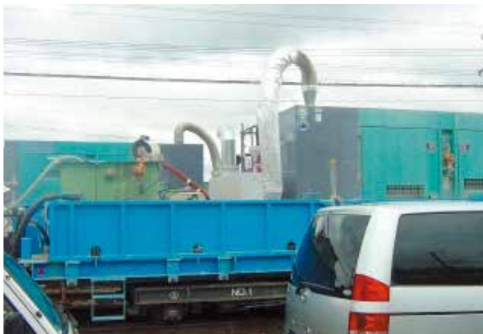
発電機(220kVA) 接続例(鉄道トンネル補修のため車両に搭載)