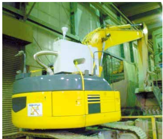
バックホー 搭載例