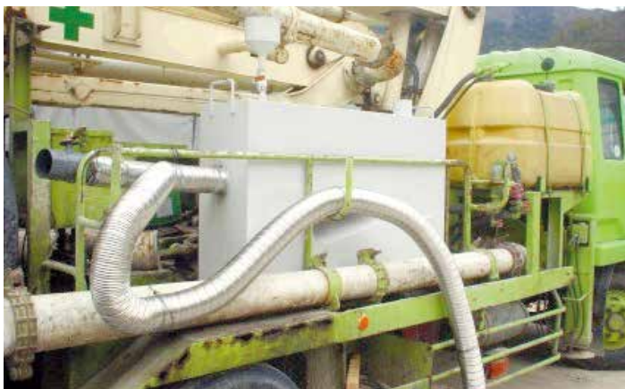
コンクリートポンプ車 搭載例