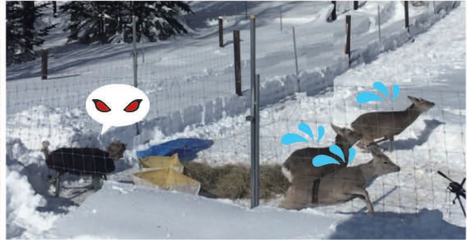
大学のシカ飼育場での検証風景(北海道網走市)