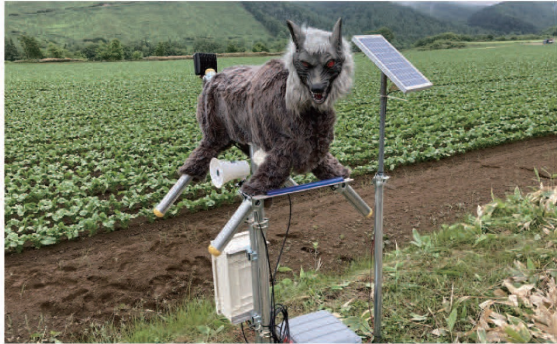
ビート畑を監視するモンスターウルフ(北海道美幌町)

野生動物(シカ・クマ・イノシシ類)の天敵であると言われる「オオカミ」に模したため、対象動物が危険を察知し、近寄らない習性を利用しています。